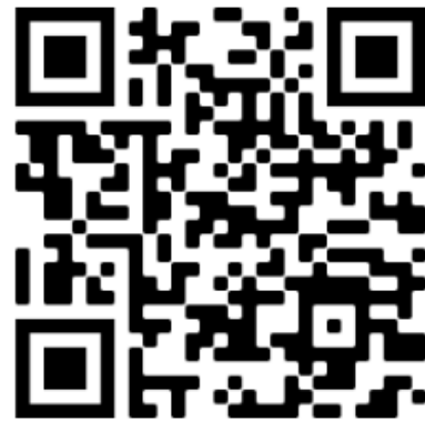
Direct Second Year

२] या प्रवेश-फेरीसाठी उपस्थित राहतांना इच्छुक विद्यार्थी यांनी त्यांचे आवश्यक ते सर्व प्रमाणपत्रे, गुण-पत्रिका, दाखले इ. मूळ प्रत व झेरॉक्स सोबत बाळगणे बंधनकारक आहे. त्यांना लागू असलेले प्रवेश-शुल्क (फी) फक्त online पद्धतीने स्वीकारण्यात येईल. (फक्त Net-banking, Debit/ Credit Card) यासाठी कोणत्याही कारणास्तव अतिरिक्त वेळ देण्यात येणार नाही.